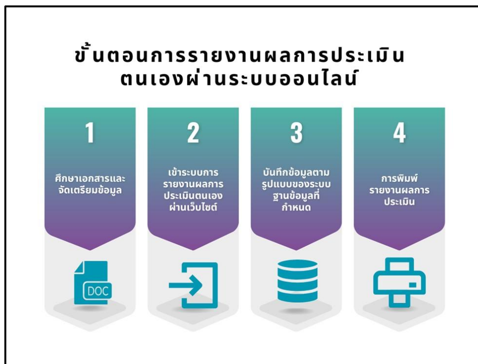
ภาพที่ 7.1 การรายงานผลการประเมินตนเองผ่านระบบออนไลน์